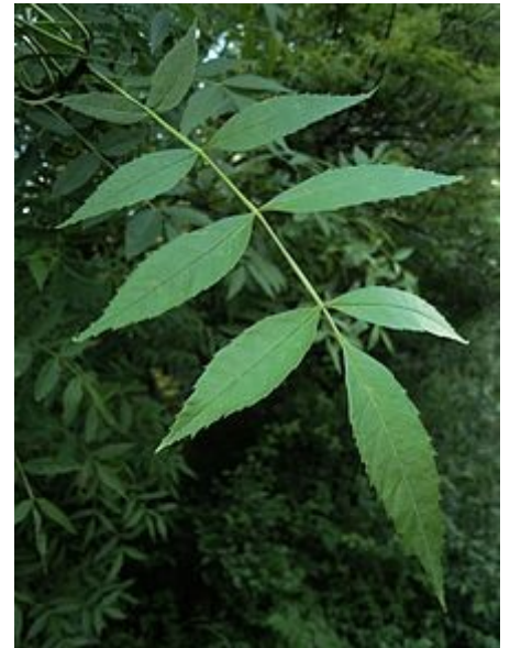
Detalle de las hojas

En los lugares donde se riega en verano con canales o regueras, se forman los productivos prados de siega con abundancia de gramíneas altas como el tortero ( Arrhenatherum bulbosum ), grama de jopillos ( Dactylis glomerata ), heno blanco ( Holcus lanatus ), cola de ratón ( Phleum pratense ) y heno de Castilla ( Agrostis castellana ). Los troncos y ramas de los fresnos se visten a menudo con una capa gris plateada de líquenes ( Parmelia glabra , Physcia leptalea , y Physcia ascendens ) y, con frecuencia, del líquen anaranjado Xanthoria parietina , ligado a los árboles iluminados y muy frecuentados por las aves. Son importantes las fresnedas que aparecen en las vertientes norte y sur del Sistema Central, en las provincias de Ávila, Segovia, y Madrid. También son importantes las fresnedas en los valles de algunas montañas en Andalucía.