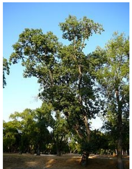
Fraxinus angustifolia subsp. angustifolia en la Casa de Campo de Madrid.